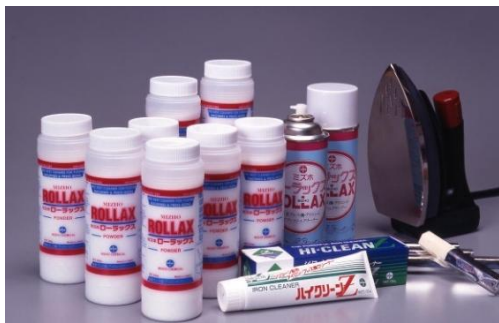
世界の縫製工場向け 接着芯地樹脂除去剤